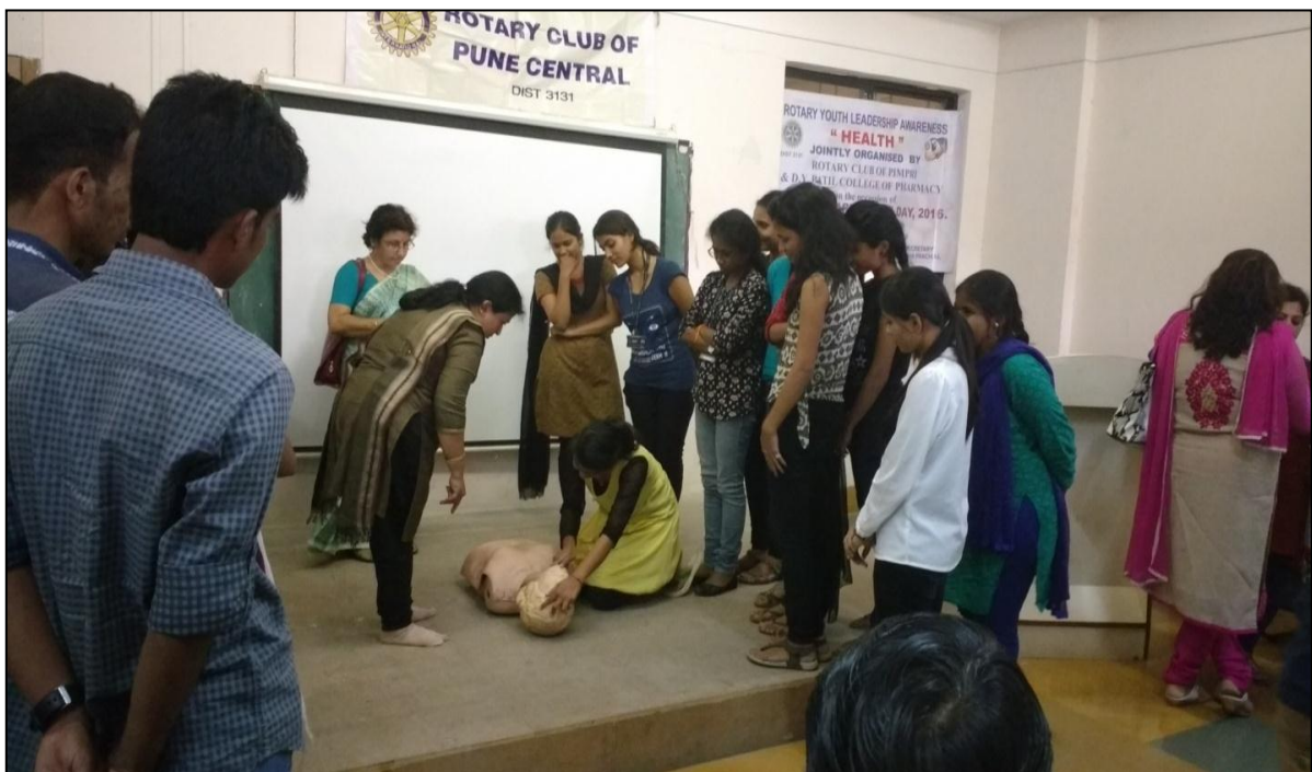
A glimpse from the seminar held by rotary club of pune on “Emergency Cardiac Resuscitation”