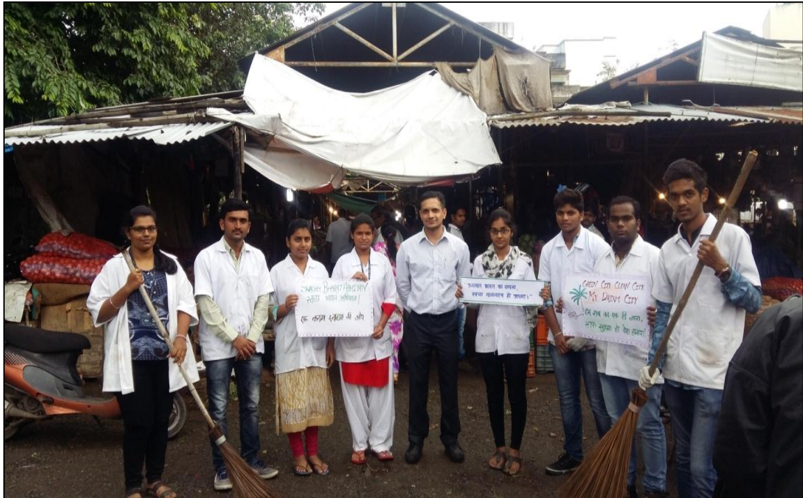
Reaching out to attain godliness at the 'Cleanliness Drive' arranged under the NSS camp