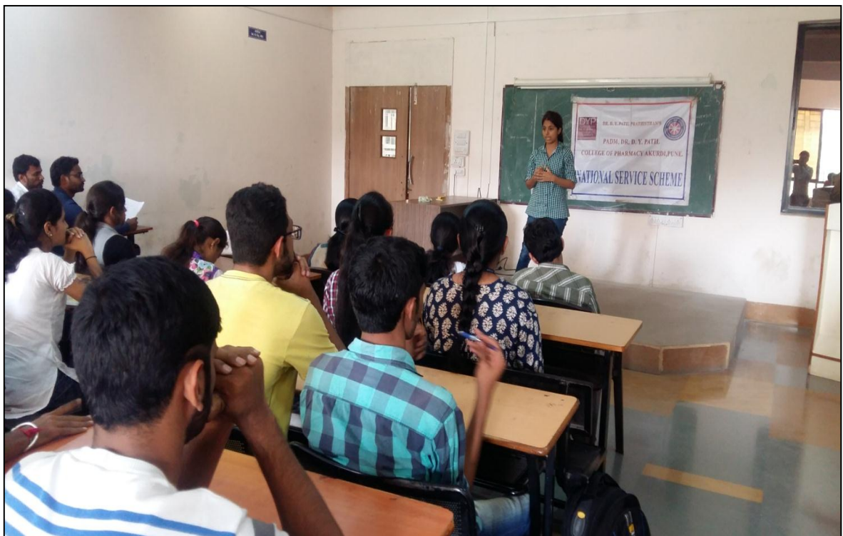
Elocution competition on "Road safety awareness"