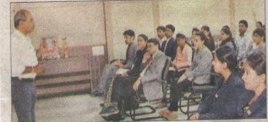
आकुडीतील डॉ. डी. वाय. पाटील कॉलेज ऑफ फार्मसीच्या वतीने 'रोल ऑफ टेक्नॉलॉजी ट्रान्स्फर इन फार्मायूटिकल इंडस्ट्रीज' या विषयावर राष्ट्रीय परिसंवादाचे आयोजन केले होते.