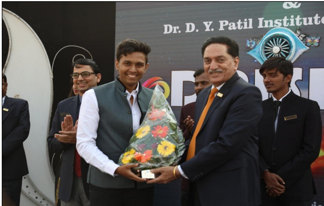
Felicitation of the students who clinched the first step of success by clearing the GPAT exam