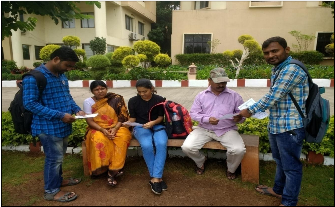
Organ donation awareness campaign by NSS volunteers