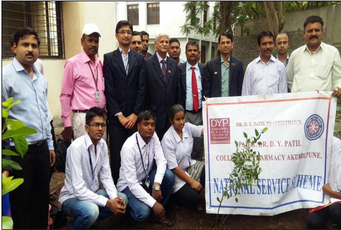
Helping grow new roots by NSS Students